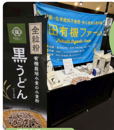
福田有機ファーム