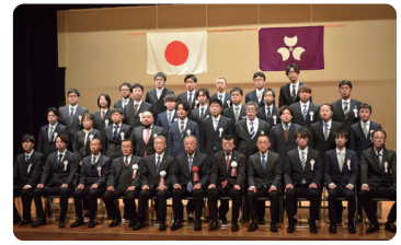
〈若手技術者奨励賞〉