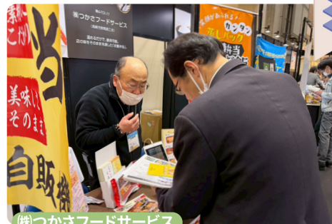
(株)つかさフードサービス