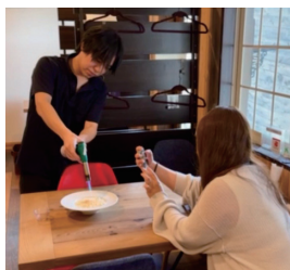
1 ダイニングキッチン ひなたや