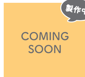
8 (株) ダンクパンズ