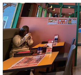
7 (株) GGC