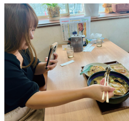
3 らーめん・ぎょうざ たつき